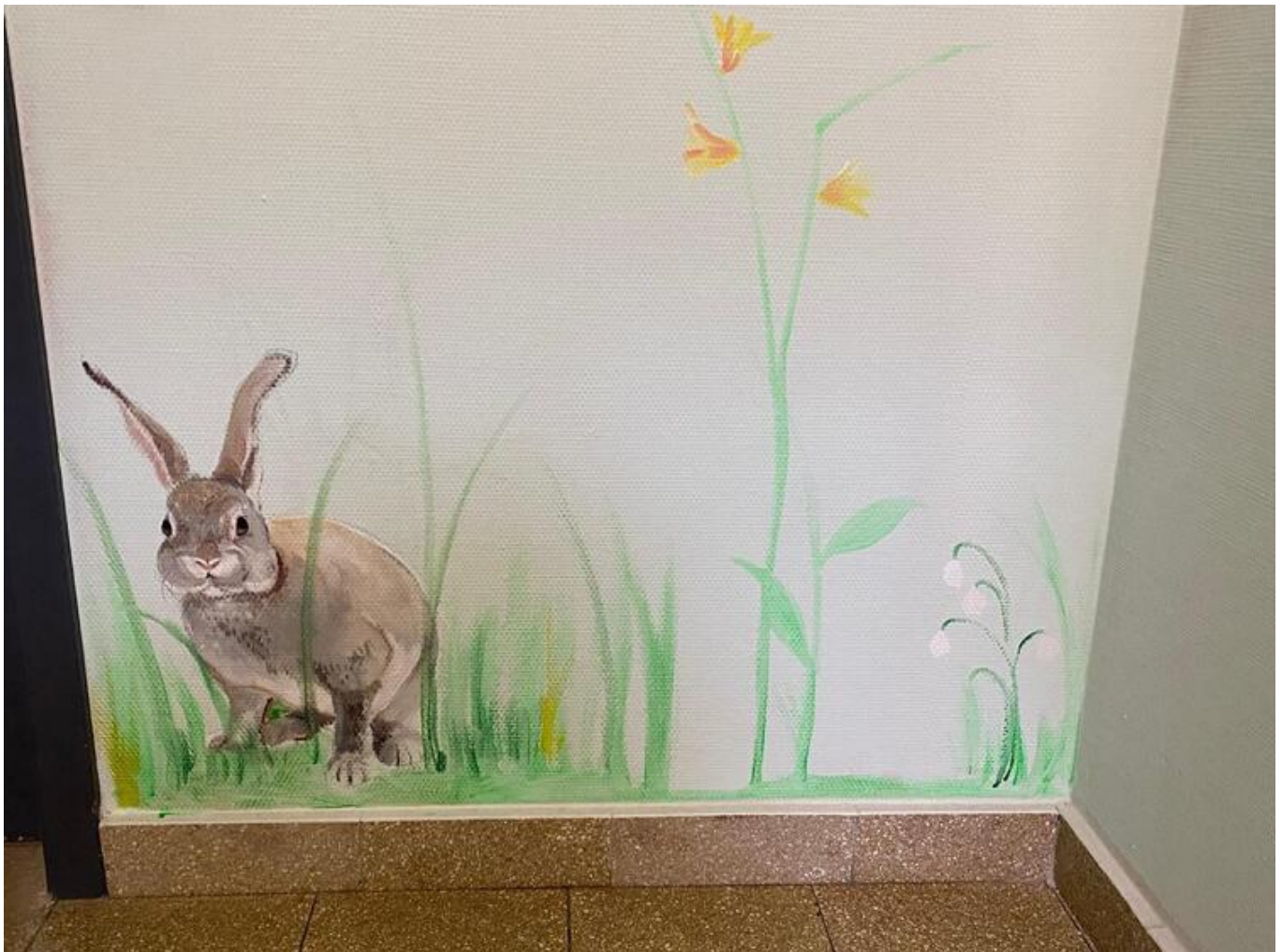
Wandschmuck in den Fluren.

Wie hieß es bei der Mond-Landung so schön: Ein kleiner Schritt für einen Menschen, aber ein gewaltiger Sprung für die Menschheit. Nun kommt bei der Internationalen Schule in Neustadt zwar niemand auf die Idee, sich mit US-Astronaut Neil Armstrong oder einer Mond-Mission zu vergleichen. Aber dennoch passt der Vergleich: Die Schule ist nur ein paar Meter weitergezogen und empfindet dies doch als ganz großen Sprung nach vorne.